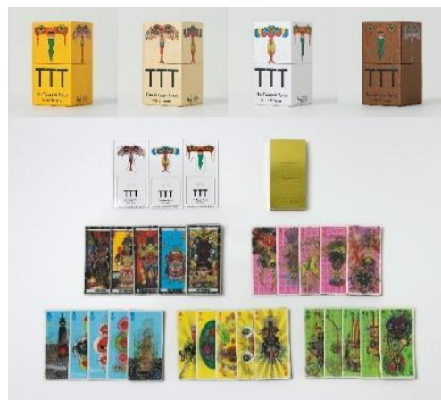
発行/集英社マンガアートヘリテージ ©Keiichi Tanaami Courtesy of NANZUKA ©Fujio Productions Ltd. / Shueisha Inc.

田名網敬一による、まったく新しいタロットカードが誕生。78枚すべてのカードは、3Dのような立体感や奥行きを出したり、角度を変えると絵柄が変化するレンチキュラー印刷を採用しています。裏面はメタリックで、縦横比が正確に2:1のカードです。一部のカードには赤塚不二夫とのコラボレーション作品「TANAAMI!! AKATSUKA!!」のイメージが含まれます。鏡リュウジ監修によるブックレットと、特製アクリルスタンドを同梱。圧倒的なイメージ喚起力を持つ、空前のコンプリートセットです。